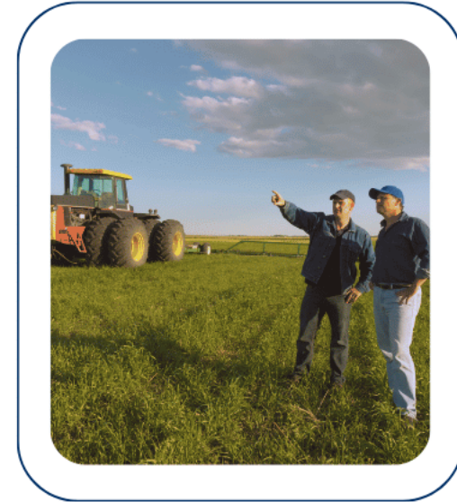
PACK ACCEPTABILITÉ Métha'Normandie