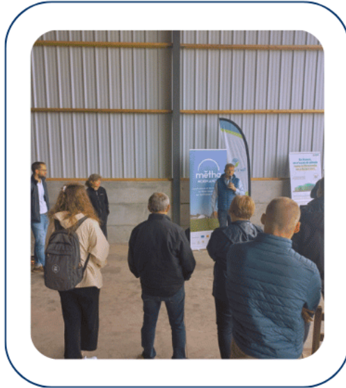
ANIMATION RENFORCÉE Ter'Bessin et SDEC Energie